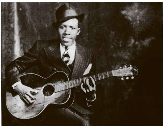
Robert Johnson (1911-1938), figure mythique du Delta blues.