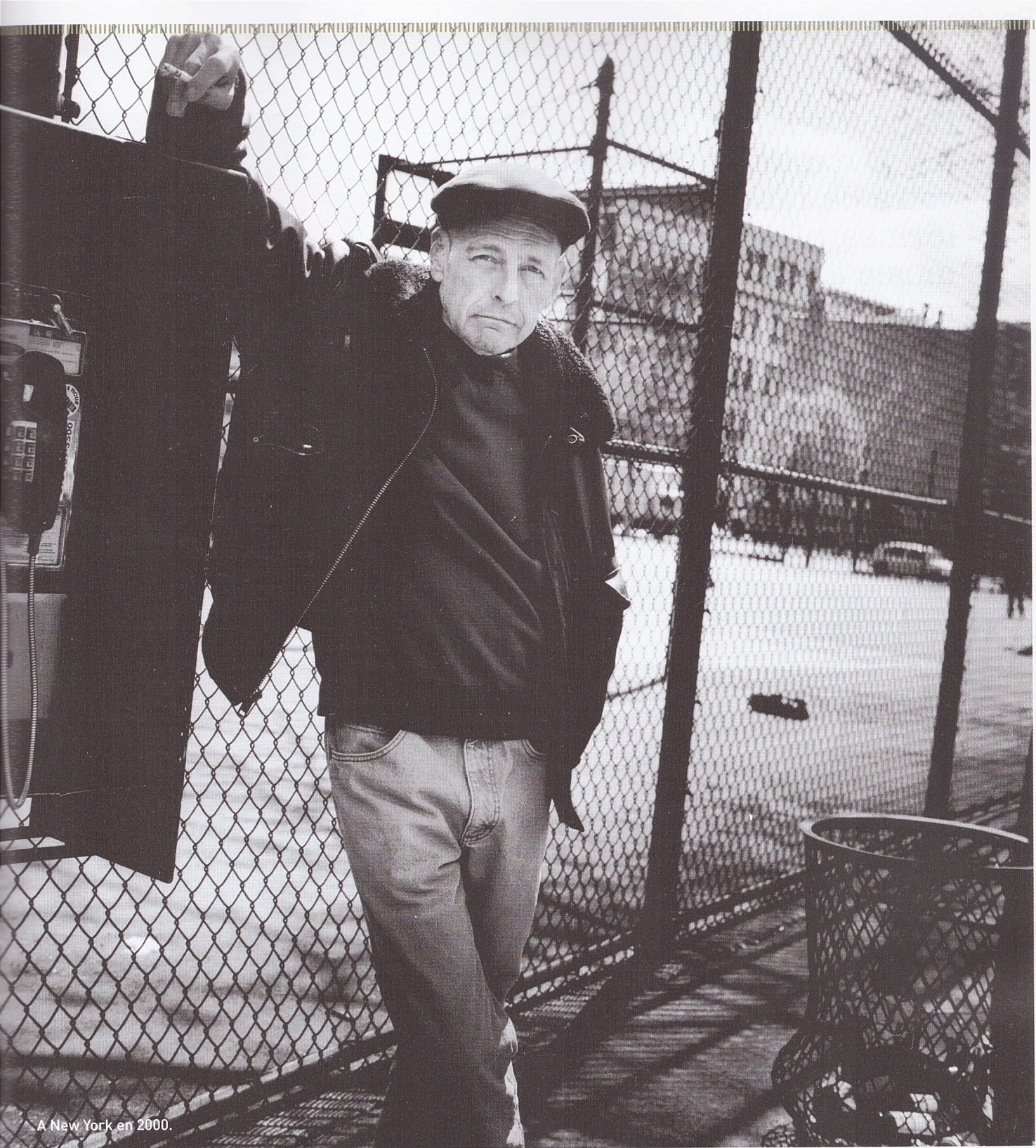
A New York en 2000.