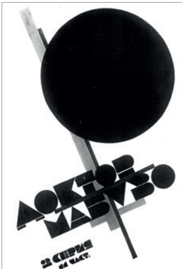
Affiche de Docteur Mabuse . Reproduite page 375.