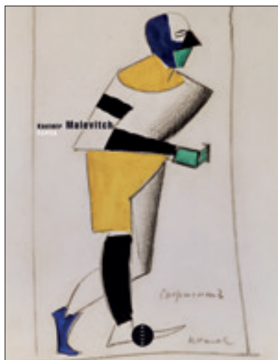
Kazimir Malévitch. Écrits Traduction de Jean-Claude Marcadé Allia – 30 €

Depuis les quatre volumes des éditions de L'Âge d'Homme , datant du milieu des années 1990, les écrits de Kazimir Malévitch n'avaient pas fait l'objet d'une réédition revue et corrigée. C'est avec un premier volume que les éditions Allia nous proposent de retrouver aujourd'hui l'intégrale des écrits publiés entre 1913 et 1930, du vivant de cet artiste.