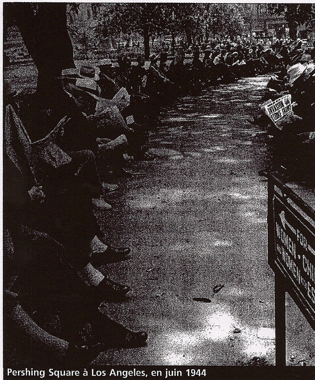
Pershing Square à Los Angeles, en juin 1944

Le fascisme n'est pas une question « allemande », Adorno s'en persuade très tôt. Ce qui s'est passé là-bas n'est que la réalisation de tendances typiques de la société occidentale dans son ensemble. Fragilisation de la fa-