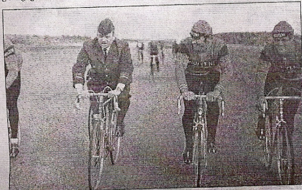
De Generaal fietsend met de Kannibaal, alias Eddy Merckx, in 1972.

de schrijvers niet bij gevestigde tijdschriften aan de bak kwamen. Een jonge kerel van niemendal moest niet proberen bij het Nieuw Vlaams Tijdschrift binnen te raken, om er maar een te noemen. Hetzelfde probleem hadden de plastische kunstenaars. Het is een rare wereld, hoor. Ik zal eens iets vertellen over de Cobra-beweging in de jaren 1948-'51. Hun tijdschrift had in België acht