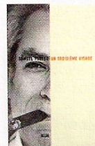
Samuel Fuller, Un troisième visage . Allia. Sortie le 18 août.