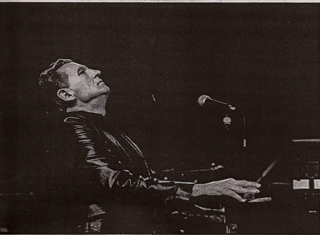
Jerry Lee Lewis à Paris en concert en 1989.

udes de Jerry Lee Lewis, surnommé «Killer», passées à l'acide par Nick Tosches.