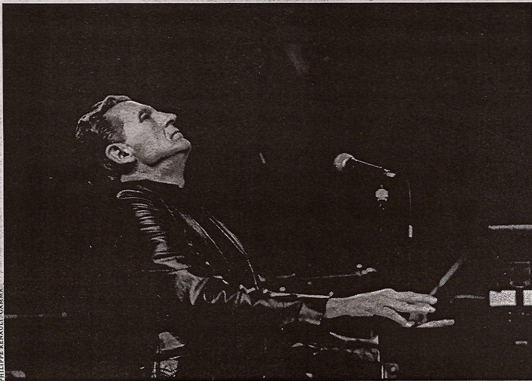
Jerry Lee Lewis à Paris en concert en 1989.

Tosches raconte l'histoire des Lewis, prise dans la glaise des rives de la Black River, marquée du signe du serpent et de la flamme de la rédemption, compliquée de mariages aussi aléatoires que consan-