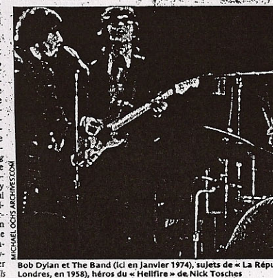
Bob Dylan et The Band (ici en janvier 1974), sujets de « La République Invisible » de Greil Marcus. En haut, Jerry Lee Lewis (ici à Londres, en 1958), héros du « Hellfire » de Nick Tosches