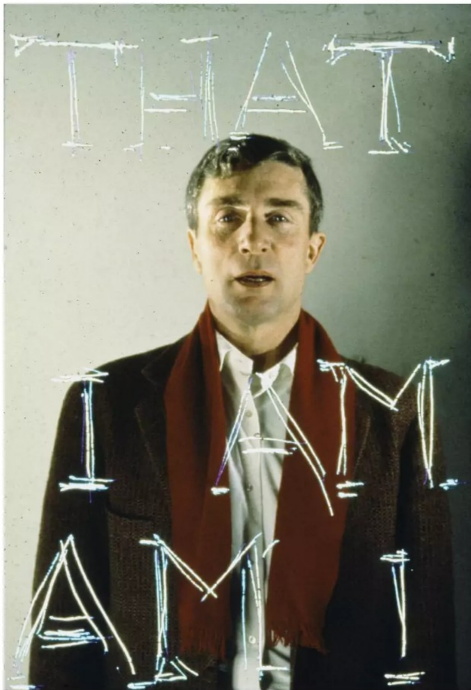
THAT I AM. Autoportrait par Brion Gysin, 1961, Musée d'Art Moderne de Paris.