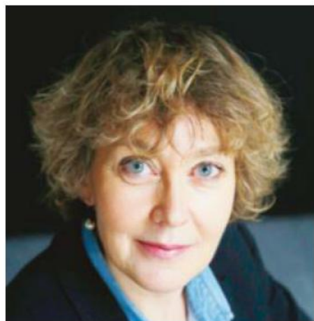
Louise Oligny/Éd. Noir sur blanc

Une longue impatience (Éd. Noir sur blanc, 2018)