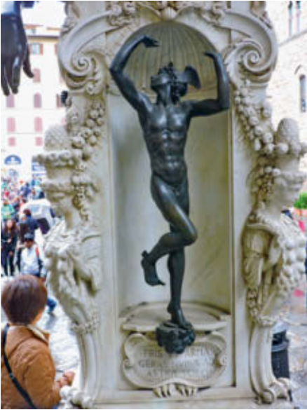
Bronze. Hauteur: 0,96 m. Florence, Loggia dei Lanzi (original conservé au Bargello)

A gauche Dormition et Assomption de la Vierge, vue du Tabernacle (1339-1349) par Andrea Orcagna à Orsanmichele (Florence).