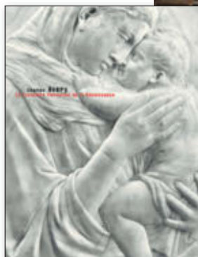
La Madone Pazzi de Donatello fait la couverture de l'ouvrage de Charles Avery.

Allia ressort un classique de l'histoire de l'art paru en 1970. La Sculpture florentine de la Renaissance de l'expert anglais Charles Avery est la boussole idéale pour naviguer des Pisano à Giambologna en passant par Donatello et Michel-Ange. Indispensable!