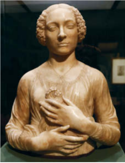
Marbre. Hauteur: 0,61 m. Museo Nazionale del Bargello, Florence