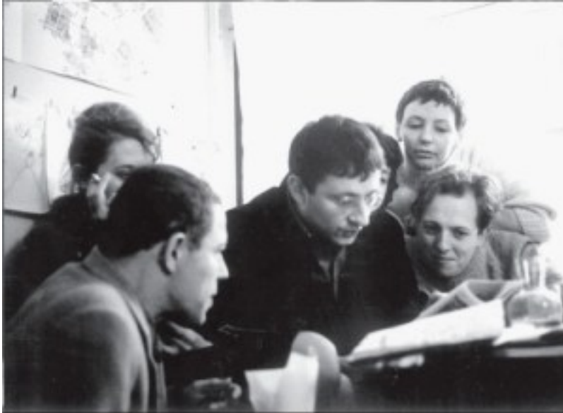
Conferentie I.S. in Antwerpen, 1962.