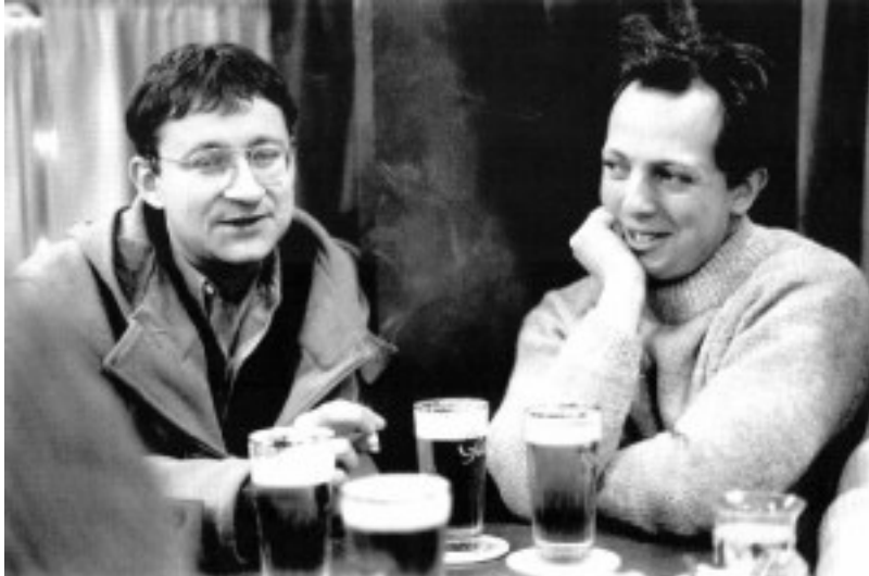
Guy Debord en Raoul Vaneigem