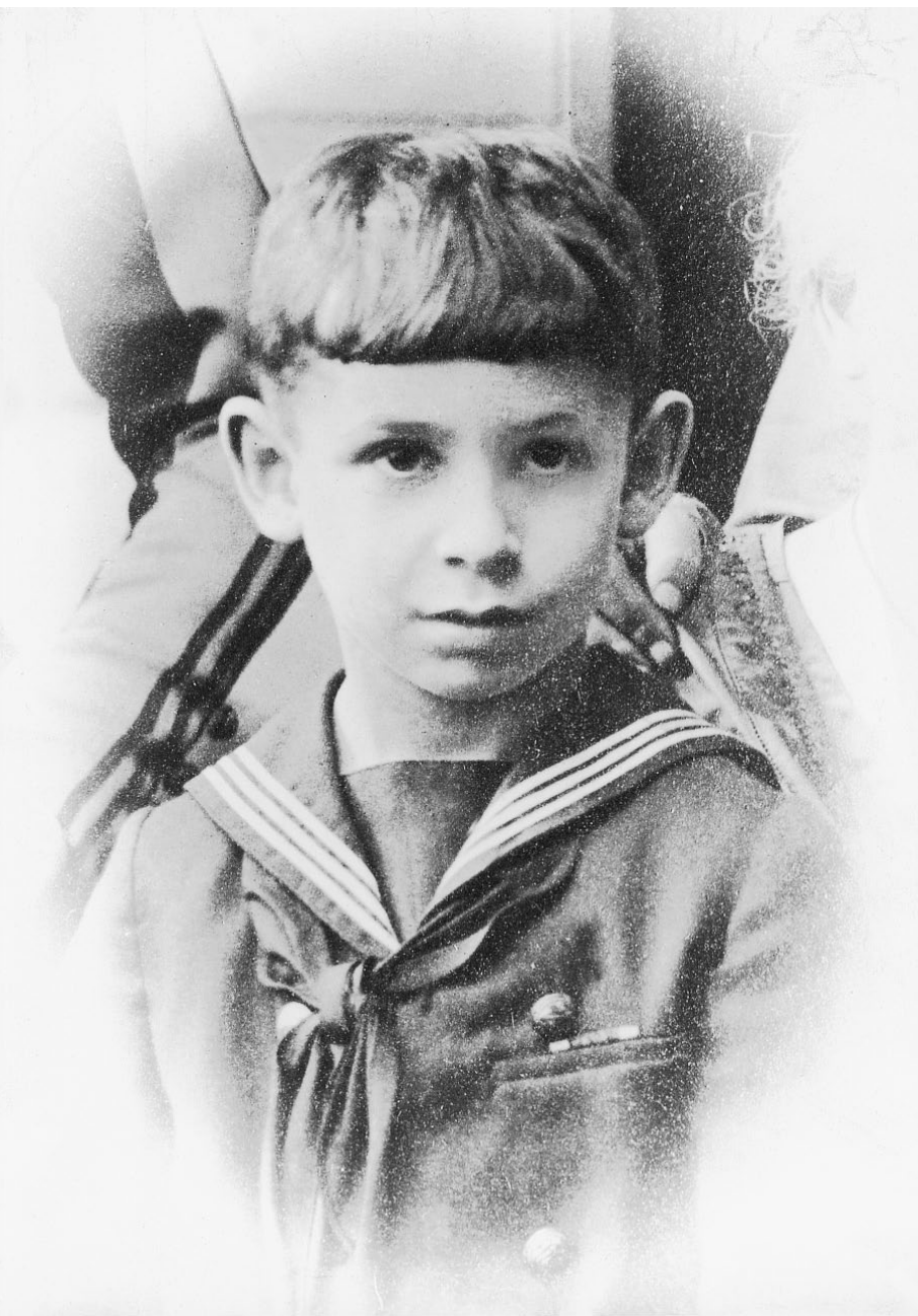
J'AVAIS ENVIRON 7 ANS QUAND J'AI PORTÉ UN UNIFORME DE MARIN POUR LA PREMIÈRE ET LA DERNIÈRE FOIS.