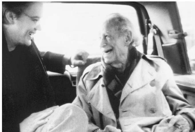
PARIS, 1994. PLAISANTANT AVEC TIM ROBBINS PENDANT LE TOURNAGE DE LA MACHINE À ÉCRIRE, LE FUSIL & LE CINÉASTE [ THE TYPEWRITER, THE RIFLE & THE MOVIE CAMERA ].

un succès, parfois c'est un flop. Il n'y a aucune garantie, mais que ce soit dans la vie ou dans les films, le courage, la persévérance et le sens de l'humour vous permettront de garder la tête hors de l'eau.