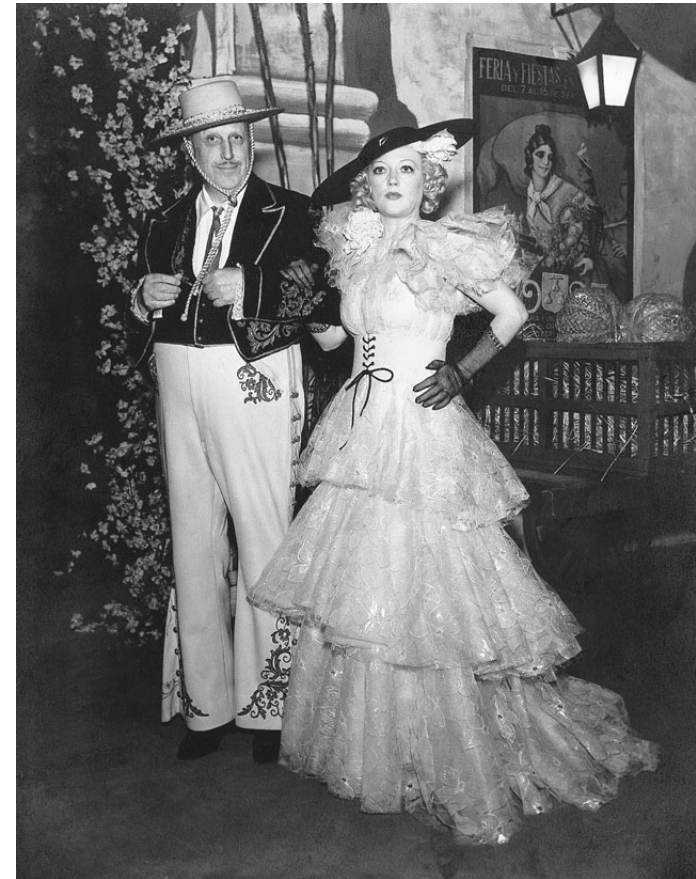
MARION DAVIES ET WILLIAM RANDOLPH HEARST LORS D'UN DES BALS COSTUMÉS QU'ILS ADORAIENT ORGANISER. JE LES AI VUS DANS LEUR APPARTEMENT LUXUEUX DE RIVERSIDE DRIVE.