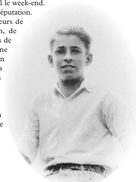
12 ANS, JE VENDAIS DES JOURNAUX À TOUTS LES COINS DE RUE DANS MANHATTAN.

Auparavant, je n'avais jamais eu conscience des classes sociales. Soudain, la réalité m'a heurté de plein fouet. Nous vivions à quelques pâtés de