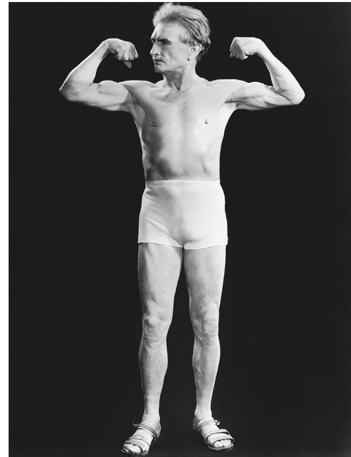
BERNARR MACFADDEN, L'ÉDITEUR DU NEW YORK EVENING GRAPHIC , VERS 1930. IL ÉTAIT EN GRANDE FORME POUR SON ÂGE ET AIMAIT LE MONTRER.

LE New York Evening Graphic était financé par Bernarr Macfadden, un Irlandais fou avec une touffe de longs cheveux et qui avait gagné des millions avec des magazines axés sur la culture physique, les histoires d’amour des célébrités, la violence, le sexe et n’importe quoi, pourvu qu’on en parle. Macfadden était hanté par le spectre de ses parents, morts de la tuberculose. Il était devenu culturiste et était obsédé par la