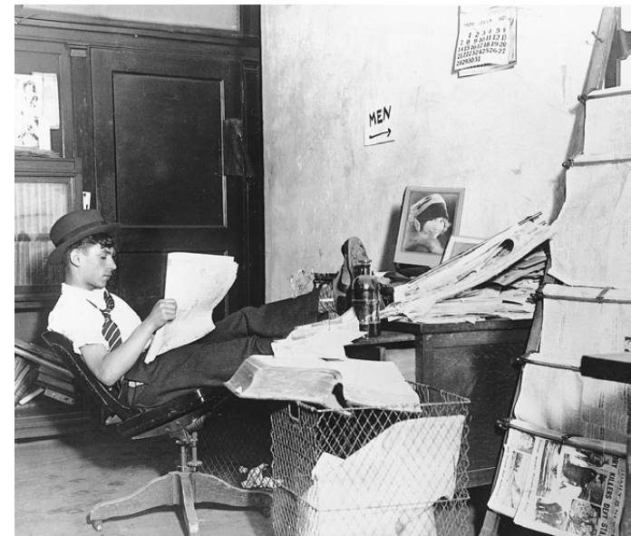
L'ANNÉE 1930. JE SUIS UN JOURNALISTE EFFRONTÉ AU GRAPHIC . J'AI UN BUREAU ENCOMBRÉ JUSTE À CÔTÉ DES TOILETTES DES HOMMES. LE PORTRAIT EST CELUI DE JEANNE EAGELS, DONT J'AI COUVERT LA MORT PRÉMATURÉE.

La tragédie de Jeanne Eagels a exercé sur moi une influence durable. Enfant, elle avait travaillé dans un cirque avant d'entrer dans le monde du théâtre. J'aime imaginer qu'elle avait été funambule parce qu'elle avait le goût du risque, aussi bien dans