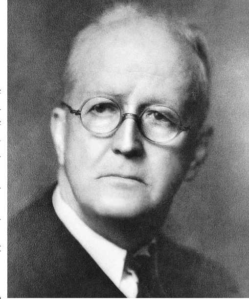
ARTHUR BRISBANE, DEMI-DIEU DE PARK ROW ET AUTEUR DE L'ÉDITORIAL DES JOURNAUX DE HEARST, CHANGERA MA VISION DU MONDE.